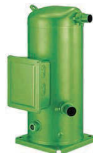
Спиральные компрессоры Bitzer

Поставляется с полной фреоновой обвязкой.